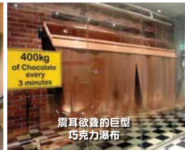
震耳欲聋的巨型 巧克力瀑布