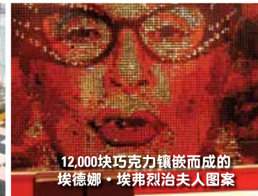
12,000块巧克力镶嵌而成的 埃德娜·埃弗烈治夫人图案