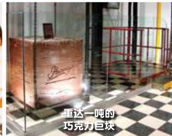
重达一吨的 巧克力巨块