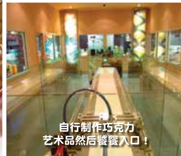
自行制作巧克力 艺术品然后饕餐入口!