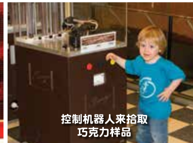
控制机器人来拾取 巧克力样品